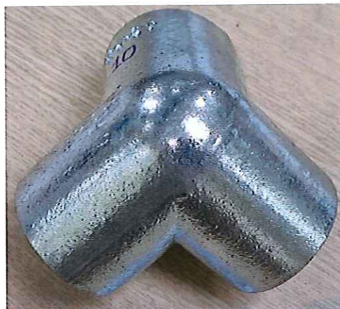
Trước khi thử phun sương muối